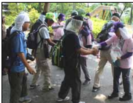
吉田山でのかち割り氷

翌16日は嵐山中ノ島公園で出発式の後、鳥居や左大文字の火床を眺め、船岡山ドリンクサービスで嬉しい一息をつきました。17 キ 、25 キ それぞれの火床観望コースを巡り、ドリンクサービス、コースガイド、チェックポイントでスタッフの応援に励まされ、猛暑をものともせず歩を進めました。途中、15時ごろから、激しいにわか雨に襲われ、去年の嵐が脳裏を横切りましたが、半時間ほどの雨宿りで天候は回復、元気にゴールしました。午後8時夜空にくっきりと浮かび上がった大の字に行く夏を惜しまました。