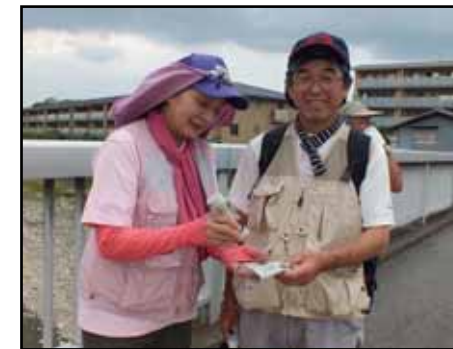
松ヶ崎橋でチェック