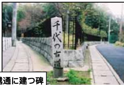
一条山越通に建つ碑