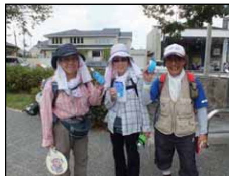
北大路橋での給水